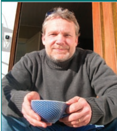
Martin Widmark, lärare och författare även till de populära LasseMaja-böckerna.