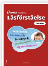
TEXTBOK ÅK 4