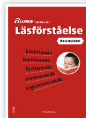
ÖVNINGSBOK ÅK 4

Miss inte heller Bums grundböcker i svenska för årskurserna 4-6.