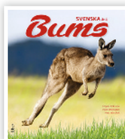
GRUNDBOK ÅK 4

Miss inte heller Bums grundböcker i svenska för årskurserna 4-6.